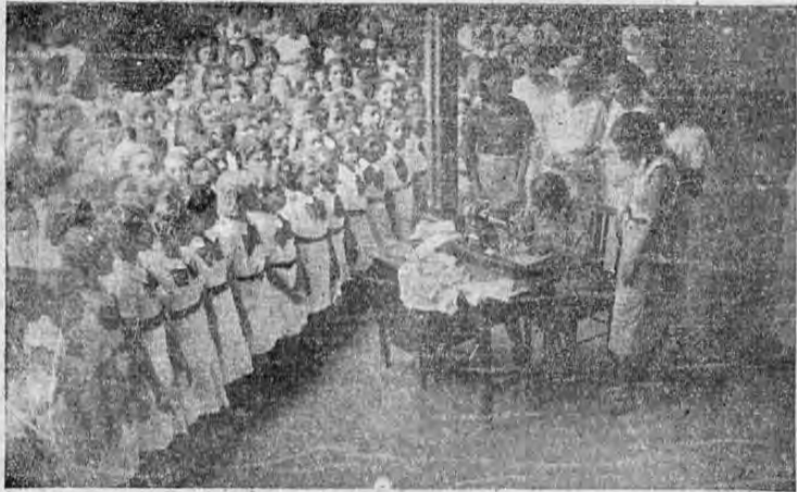
En esta gráfica puede verse a algunas de las alumnas del Colegio de Señoritas de Managua, presenciando en compañía de varias profesoras, la sorprendente labor que realiza la máquina de coser ADLER, la cual ha sido tan justamente admirada por quienes han tenido ocasión de ver cómo trabaja.

El lunes dará una exhibición especial para las alumnas del Colegio Superior de Señoritas. Ha llamado poderosamente la atención de nuestras damas la forma en que trabaja la máquina sin necesidad de implemento alguno